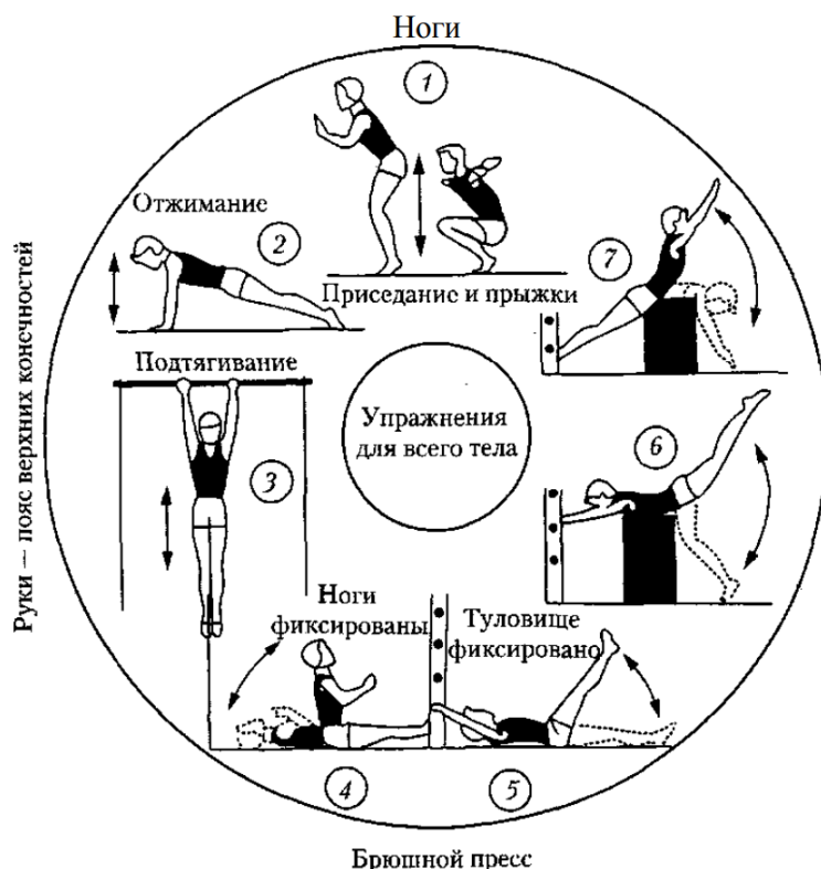
Метод круговой тренировки

Круговой метод представляет собой последовательное выполнение специально подобранных физических упражнений, воздействующих на различные мышечные группы и функциональные системы. Для каждого упражнения определяется место или «станция».