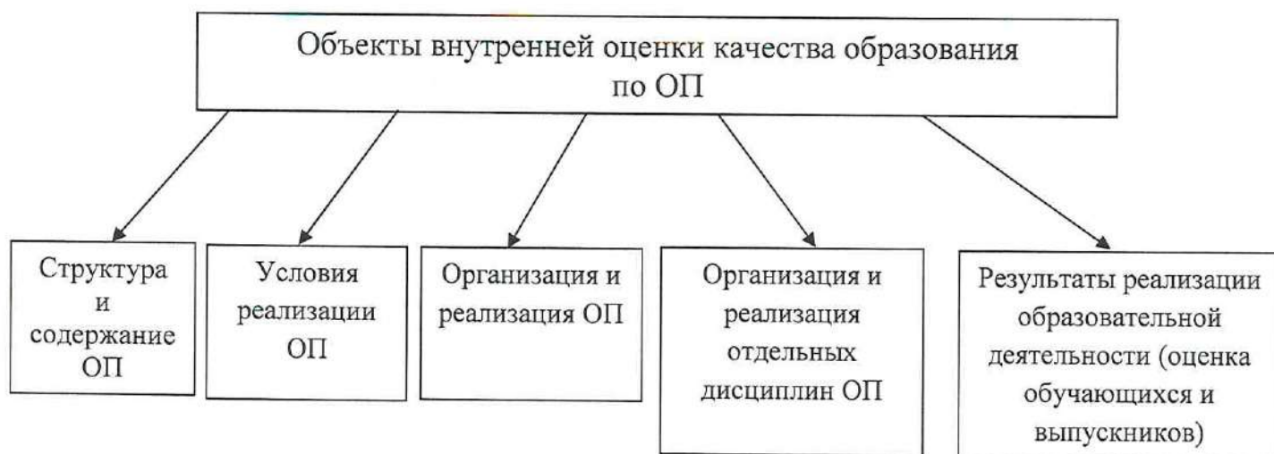
Рисунок 2 – Объекты внутренней оценки качества образования

3.4.1 Оценка качества структуры и содержания ОП производится по следующим параметрам для каждой из составляющих ОП: