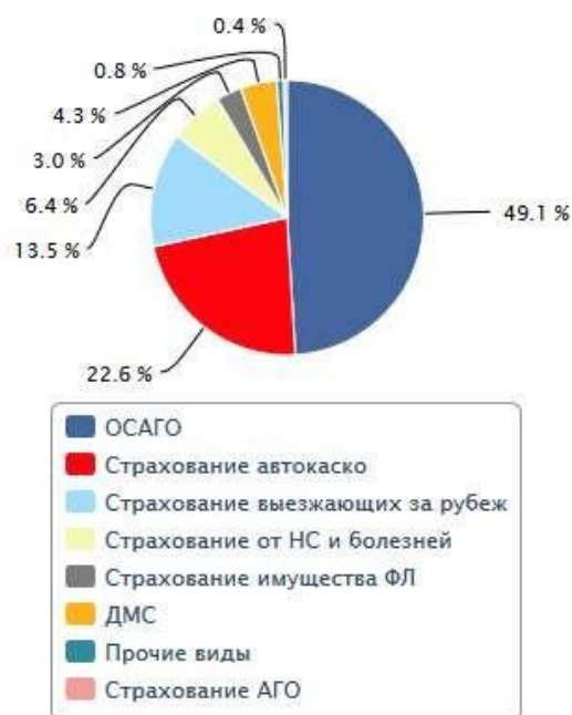
График 5. Структура директ-страхования по видам страхования, 1 полугодие 2016 года