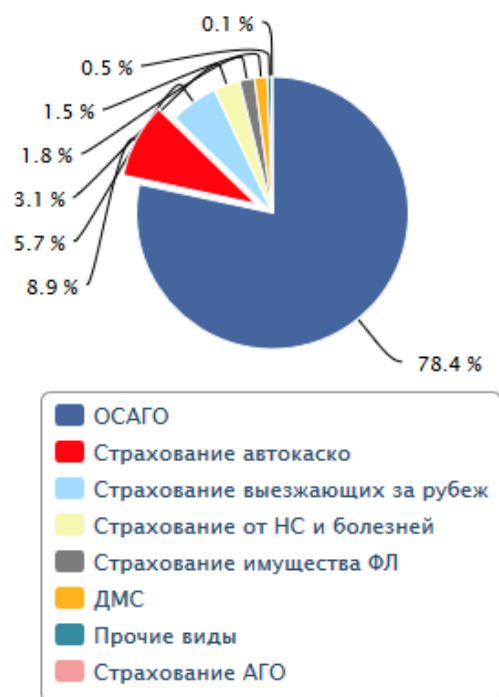
График 4. Структура директ-страхования по видам страхования, 1 полугодие 2017 года