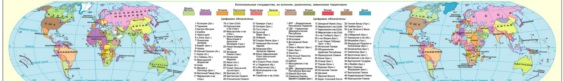
МИР в 1961 г.