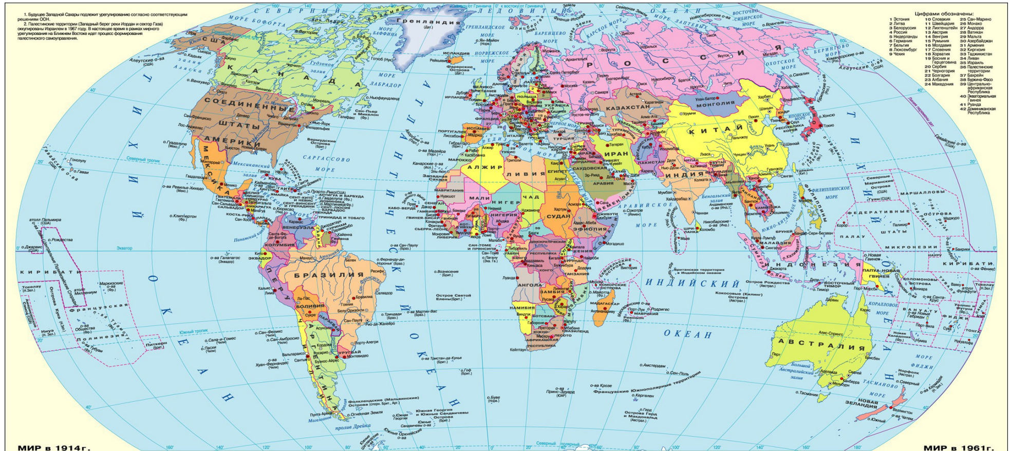
МИР в 1914 г.