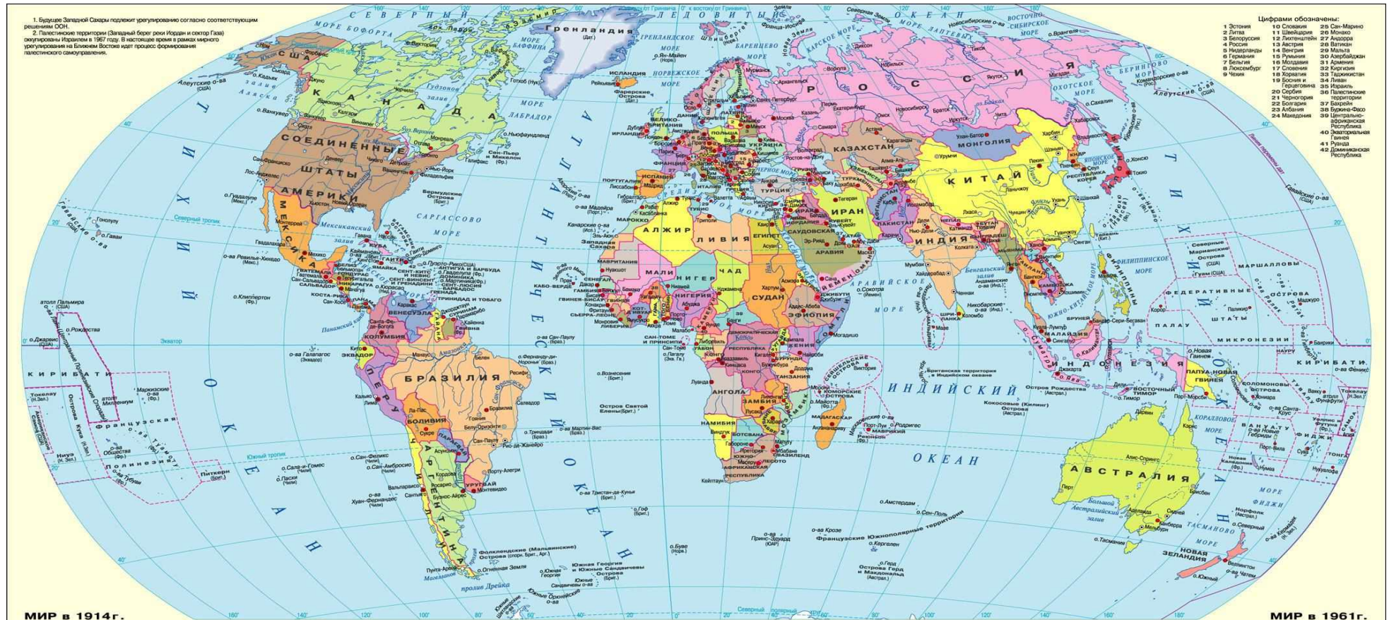
МИР в 1914 г.