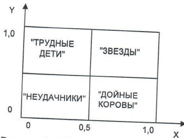
Рисунок 1 – Матрица «Бостон консалтинг групп»

«Звезды» действуют в условиях быстро расширяющегося рынка. Основная цель стратегии фирмы на таком рынке заключается в поддержании, а по возможности, и наращивании сравнительных конкурентных преимуществ. Прибыль от «звезд» значительная, но они требуют и большого финансирования для своего развития. Основные варианты стратегии для этой группы продуктов: снижение цены; наращивание рекламных усилий; дальнейшее совершенствование продукции; более обширное распределение.