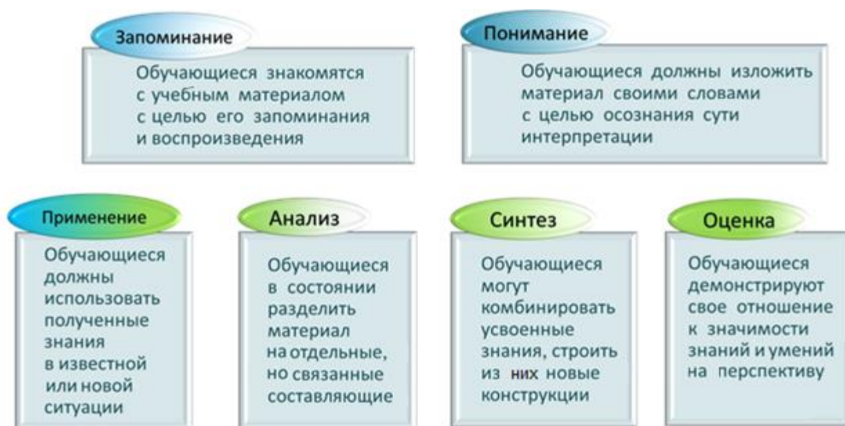
Рис. 1. Блок-схема описания категорий (по Б. Блуму) мыслительного процесса обучающихся

Согласно теории Б. Блума на первой ступени обучения достигается так называемый низкий уровень мыслительных способностей, к которому относится знание и понимание (см. рис.1). После этого у обучающегося формируется базовый уровень – это применение, а затем усилия направляются на овладение мышлением высокого уровня, включающего анализ, синтез и оценку. В зависимости от поставленных учебных целей, места в основной образовательной программе (в начале, в центре или к концу обучения) все изучаемые дисциплины можно систематизировать по данному признаку и соответственно проектировать их содержание и необходимые оценочные средства для аттестационной процедуры.